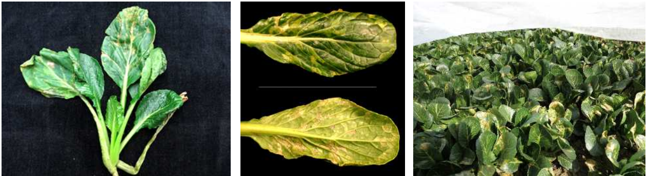
図1 病徴およびほ場における被害